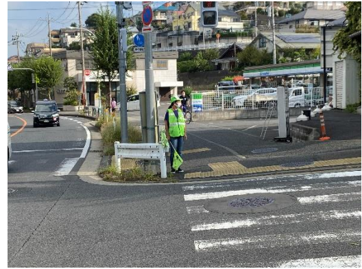
通学児童見守り (栗谷交差点)