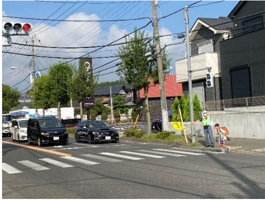
通学児童見守り (金井小学校下交差点)