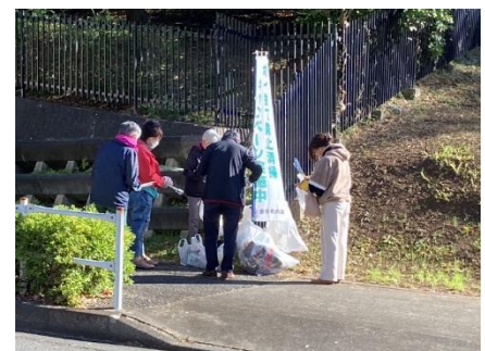
ポイ捨て清掃キャンペーン