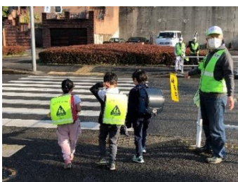
通学児童見守り（森の丘入口交差点）

② 容器に貼り付けてある金井町内会のシールが視認しづらくなったため、全ての容器のシールを貼り換えました。